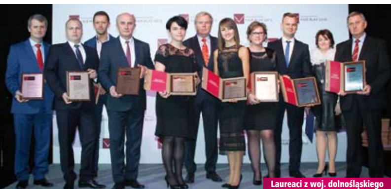
Laureaci z woj. dolnośląskiego