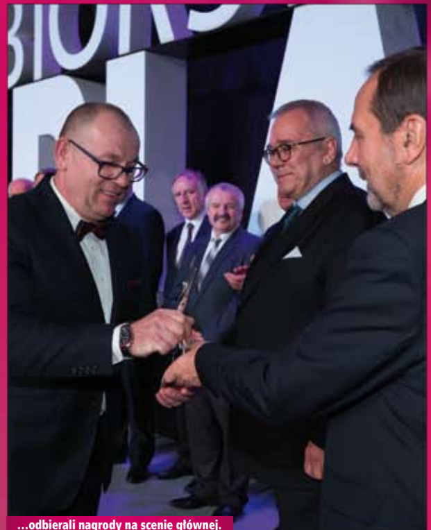
...odbierali nagrody na scenie głównej.