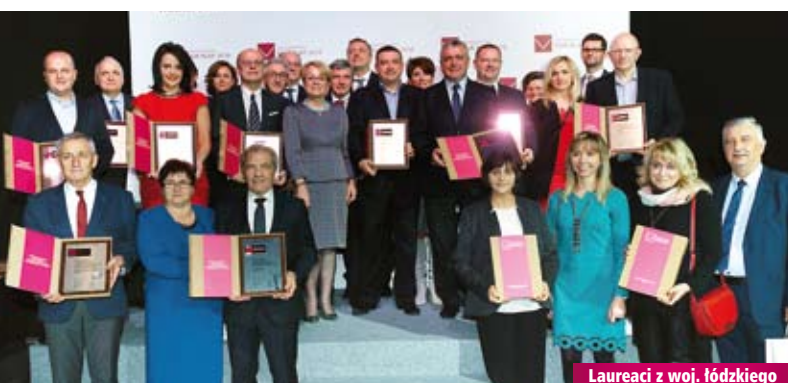
Laureaci z woj. łódzkiego