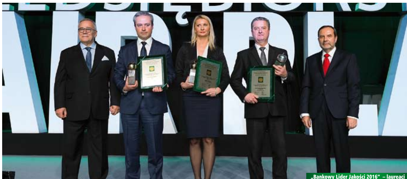
„Bankowy Lider Jakości 2016” – laureaci

POMORSKI BANK SPÓŁDZIELCZY W ŚWIDWINIE ul. Niedziałkowskiego 5, Świdwin www.pomorski-bs.pl Uczestnik nagrodzony Platynową Statuetką