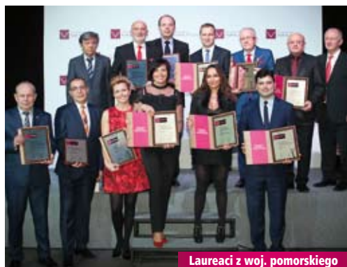
Laureaci z woj. pomorskiego