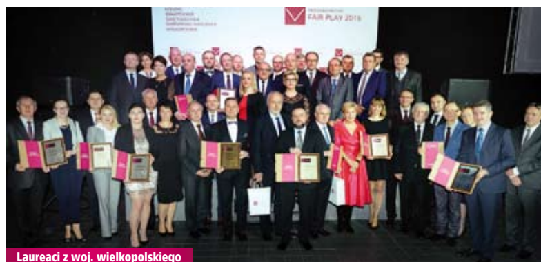
Laureaci z woj. wielkopolskiego