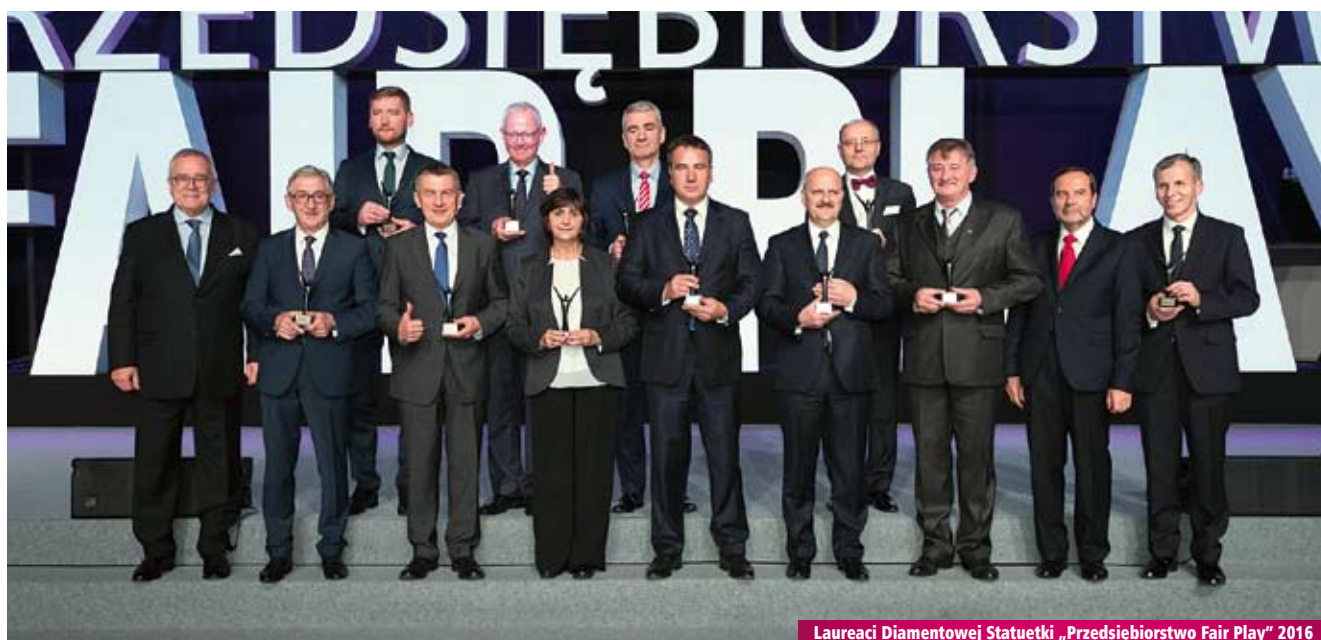
Laureaci Diamentowej Statuetki „Przedsiębiorstwo Fair Play” 2016

„TORNADO” - WPTS SP. Z O.O. Poznań, woj. wielkopolskie www.tornado.poznan.pl