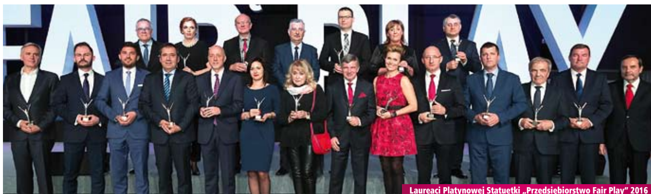
Laureaci Platynowej Statuetki „Przedsiębiorstwo Fair Play” 2016

Zabrzeńskie Przedsiębiorstwo Wodociągów i Kanalizacji Sp. z o.o. Zabrze, woj. śląskie www.wodociagi.zabrze.pl