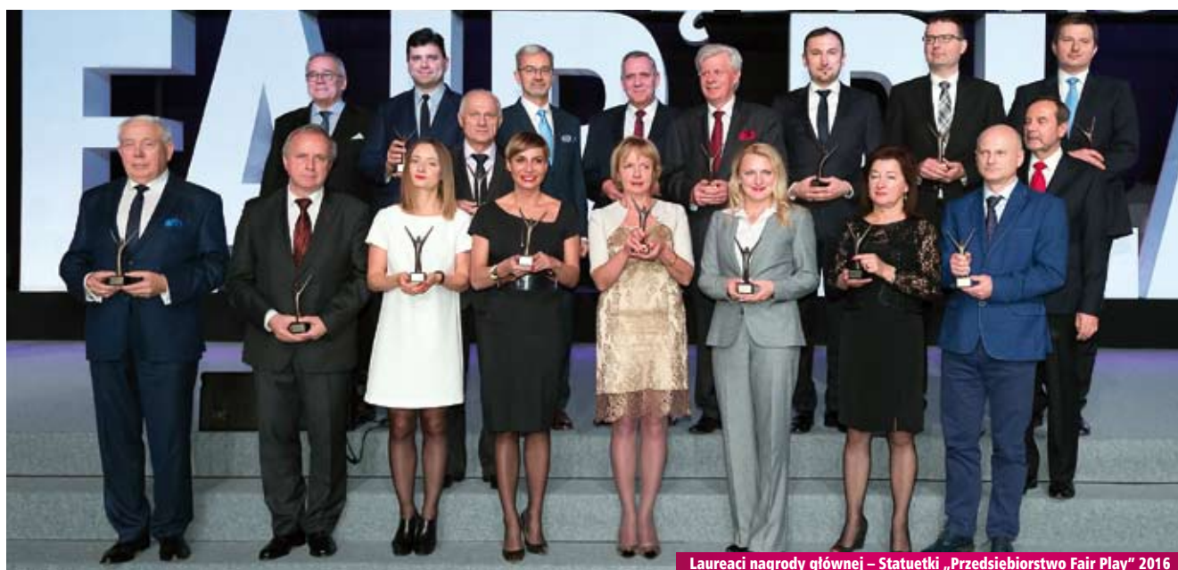
Laureaci nagrody głównej – Statuetki „Przedsiębiorstwo Fair Play” 2016