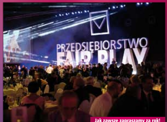
Jak zawsze zapraszamy za rok!