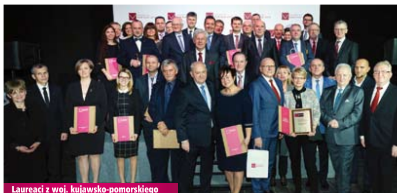
Laureaci z woj. kujawsko-pomorskiego