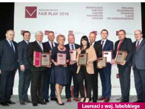
Laureaci z woj. lubelskiego