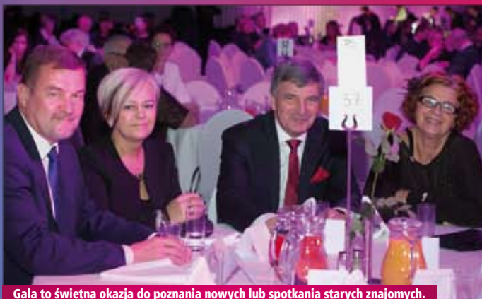
Gala to świetna okazja do poznania nowych lub spotkania starych znajomych.