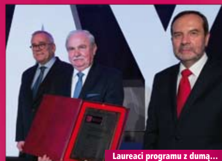
Laureaci programu z dumą...