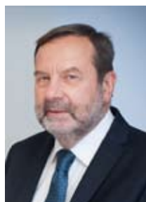
Mieczysław Bąk Prezes Instytutu Badań nad Demokracją i Przedsiębiorstwem Prywatnym