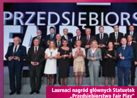
Laureaci nagród głównych Statuetek „Przedsiębiorstwo Fair Play”