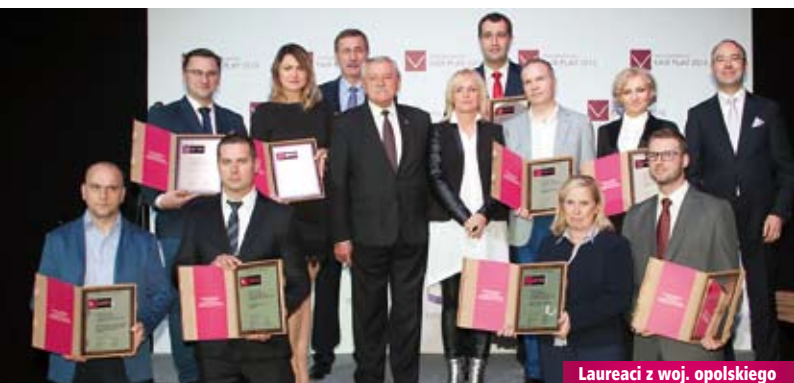
Laureaci z woj. opolskiego