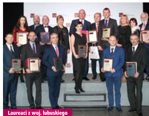
Laureaci z woj. lubuskiego