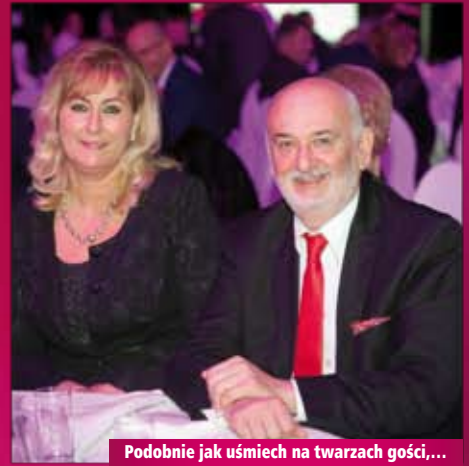
Podobnie jak uśmiech na twarzach gości,...