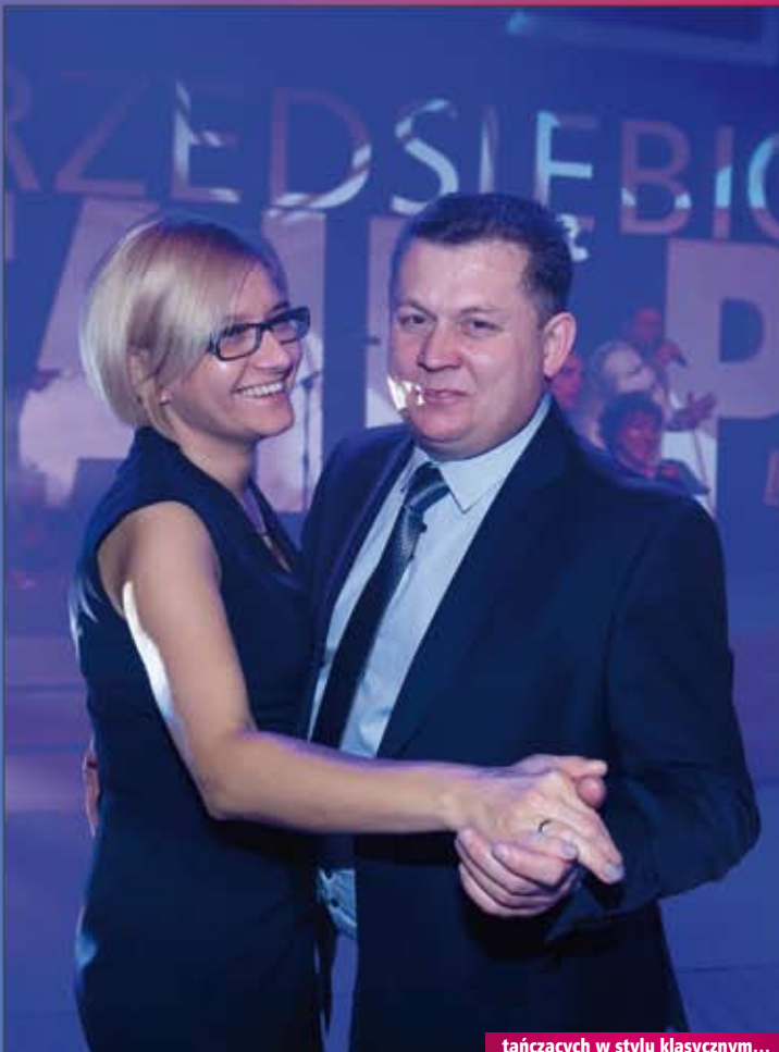
tańczących w stylu klasycznym...