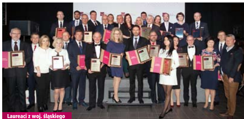
Laureaci z woj. śląskiego