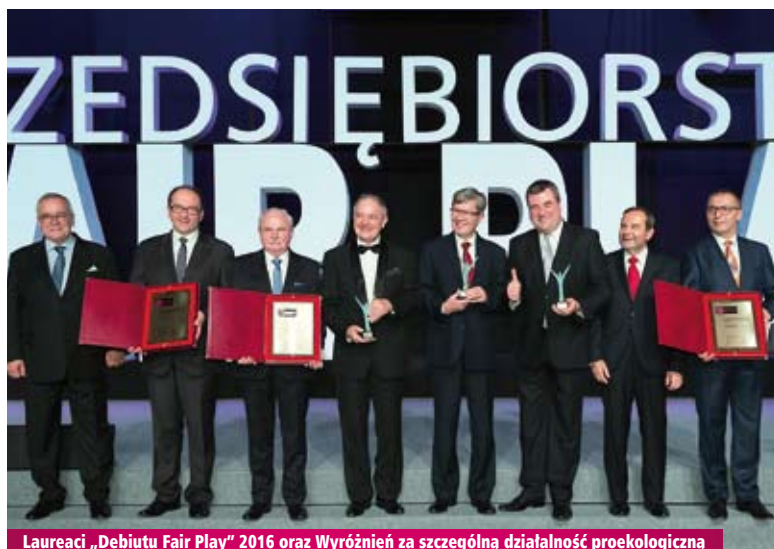
Laureaci „Debiutu Fair Play” 2016 oraz Wyróżnień za szczególną działalność proekologiczną

Rekopol Organizacja Odzysku Opakowań S.A. Warszawa, woj. mazowieckie www.rekopol.pl