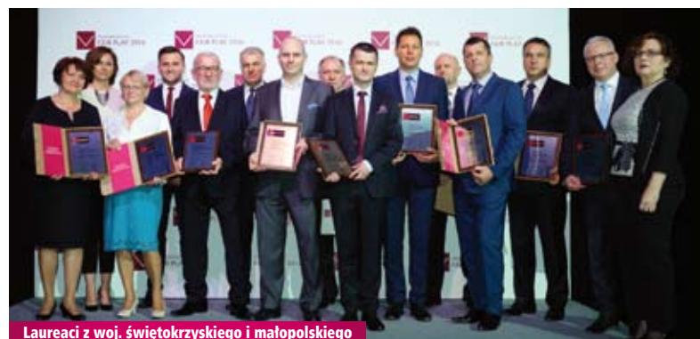
Laureaci z woj. świętokrzyskiego i małopolskiego