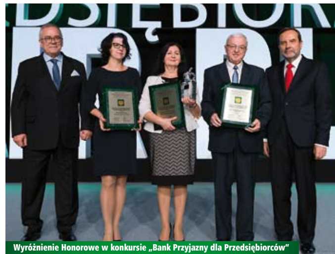
Wyróżnienie Honorowe w konkursie „Bank Przyjazny dla Przedsiębiorców”

REJONOWY BANK SPÓŁDZIELCZY W LUTUTOWIE ul. Klonowska 2, Lututów www.rbs.lututow.pl