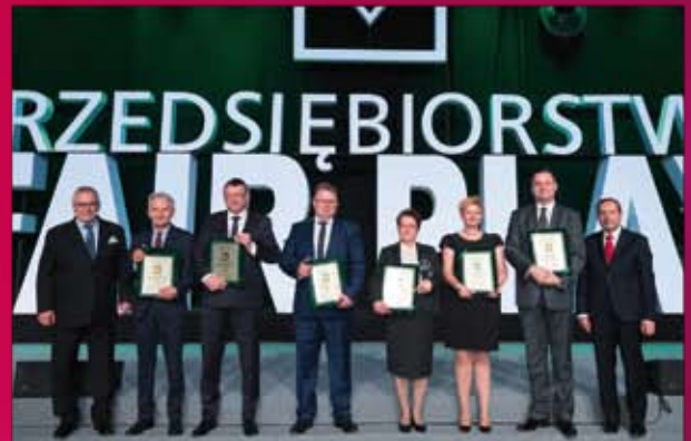
Banki nagrodzone tytułem Laureata konkursu Bankowy Lider Jakości 2016