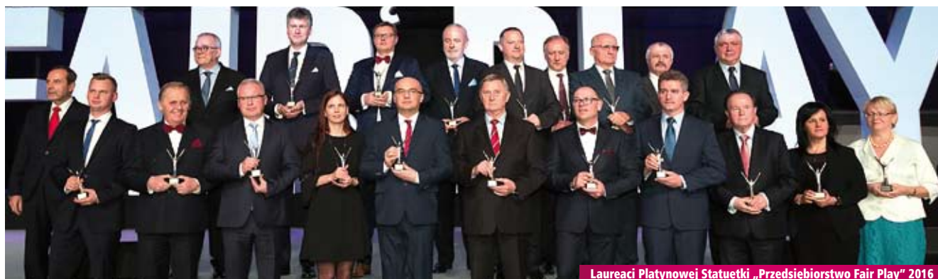
Laureaci Platynowej Statuetki „Przedsiębiorstwo Fair Play” 2016

Miejskie Przedsiębiorstwo Energetyki Ciepłej S.A. w Krakowie woj. małopolskie www.mpec.krakow.pl