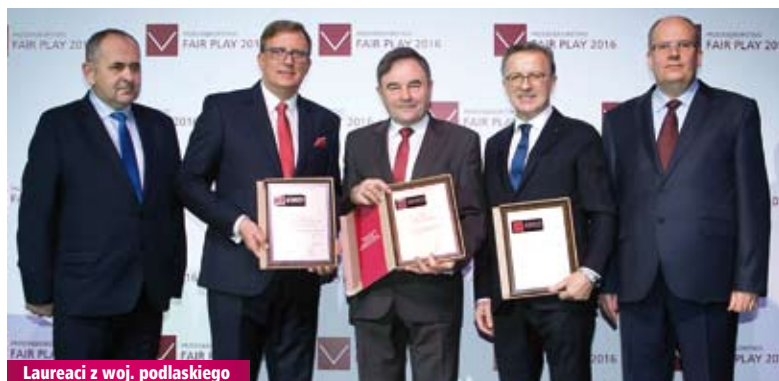
Laureaci z woj. podlaskiego