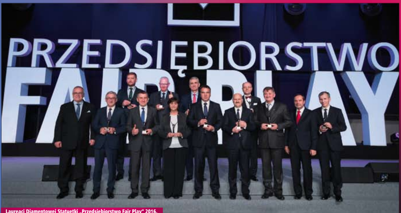
Laureaci Diamentowej Statuetki „Przedsiębiorstwo Fair Play” 2016.