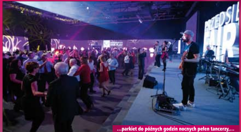
...parkiet do późnych godzin nocnych pełen tancerzy,...