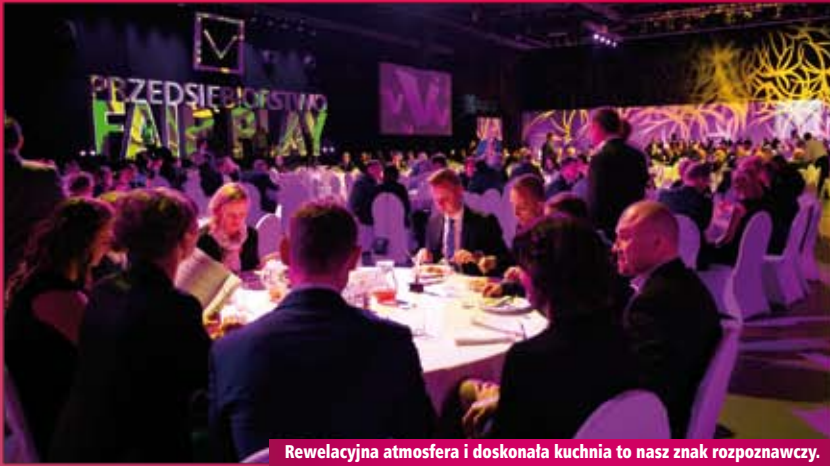
Rewelacyjna atmosfera i doskonała kuchnia to nasz znak rozpoznawczy.