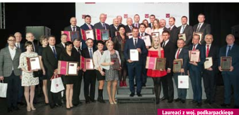
Laureaci z woj. podkarpackiego