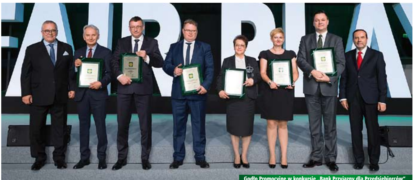
Godło Promocyjne w konkursie „Bank Przyjazny dla Przedsiębiorców”

BANK SPÓŁDZIELCZY W SŁAWNIE ul. Kopernika 5, Sławno www.bs sławno.pl