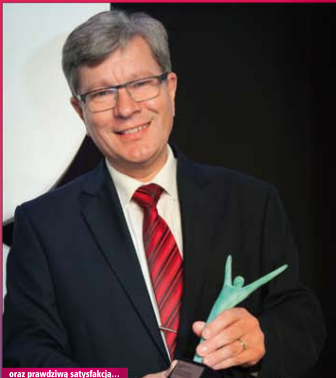
oraz prawdziwą satysfakcją...